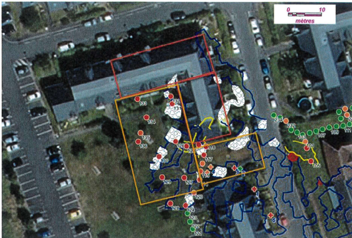
Figure 1: Zones en aléa fort en rouge du bâtiment sis 3 allée des Charmilles - Aile sud évacuée (entrée 3A) - Aile nord à évacuer (3B) - En orange : zones de restriction de passage