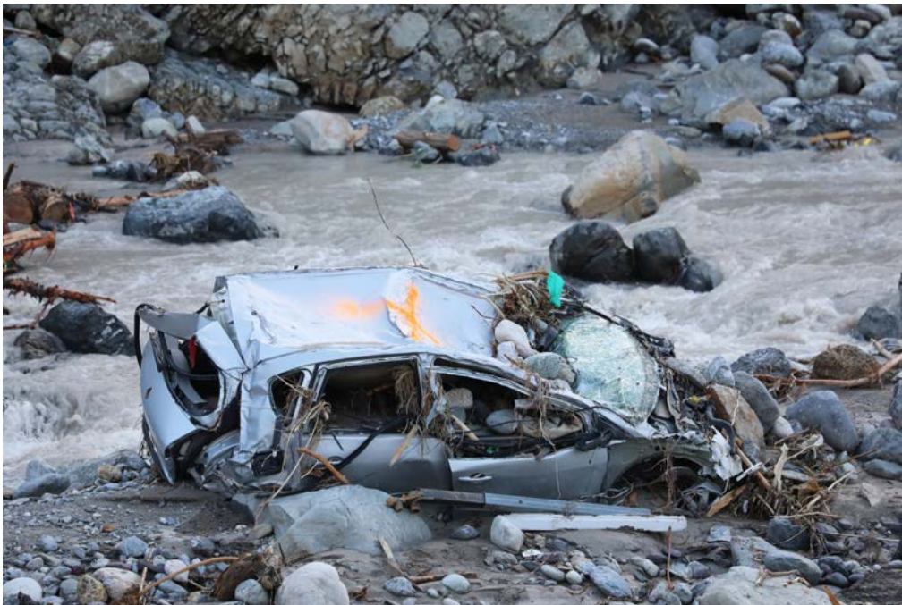
Breil-sur-Roya, France, le 8 octobre 2020