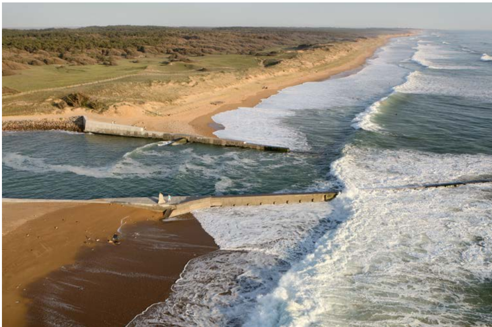
Barrage de la Gachère, entre Brétignolles-sur-Mer et Olonne-sur-Mer, situé à l'ouest de la Vendée, France.

Mais ils sont incapables de prévoir les répercussions sur terre d'une surcote. 3