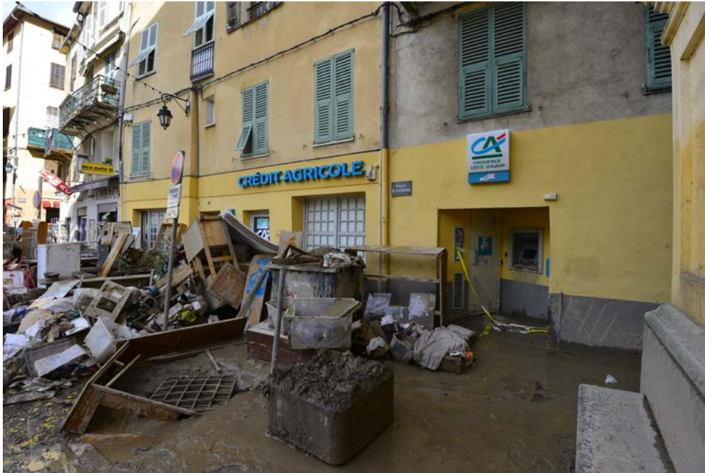
Breil-sur-Roya, France, le 10 octobre 2020, dégâts de la tempête Alex

Tous les ans, des milliers de Français doivent évacuer leur domicile.